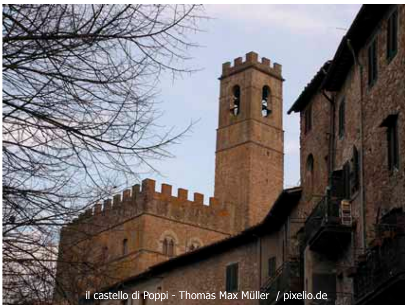
il castello di Poppi

"Cominciasti nel 1289 con la battaglia di Campaldino, la piana che sta proprio sotto il castello, e poi ci tornai varie volte dopo l'esilio, ora non ri-